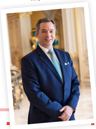
Groussherzog Guillaume

D'Verfassung gesäit keng offiziell Aufgab oder Roll fir de Partner oder d'Partnerin vum Groussherzog oder der Groussherzogin vir. D'Partner engagéieren sech awer dacks a soziale, kulturellen a karitative Beräicher. D'Groussherzogin Stéphanie setzt sech zum Beispill mat der Fondation Cancer fir Mënsche mat Kriibs an an ass Presidentin vum Lëtzebuerger Roude Kräiz.