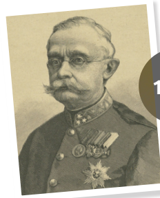
Groussherzog Adolphe von Nassau-Weilburg

Nei Verfassung: Déi nei Verfassung limitéiert d'Muecht vum Groussherzog oder der Groussherzogin a fixéiert d'Roll vu Regierung a Chamber.