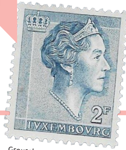
Groussherzogin Charlotte (1896 - 1985)