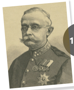
Grand-Duc Adolphe de Nassau-Weilbourg

Nouvelle Constitution : réduit les pouvoirs grand-ducaux et acte le rôle déterminant du Gouvernement et du Parlement.