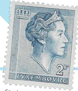
Grande-Duchesse Charlotte (1896 - 1985)

Ces attributions nécessitent toujours l'accord du gouvernement.