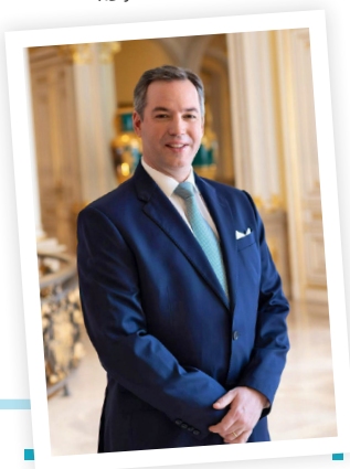
Grand-Duc Guillaume

La Constitution ne prévoit pas de fonction ni de rôle officiel pour l'épouse du chef d'État. Elle s'engage souvent dans des domaines sociaux, culturels et caritatifs. La Grande-Duchesse Stéphanie apporte par exemple son soutien à la Fondation Cancer, qui vient en aide aux personnes atteintes de cancer et est présidente de la Croix-Rouge luxembourgeoise.