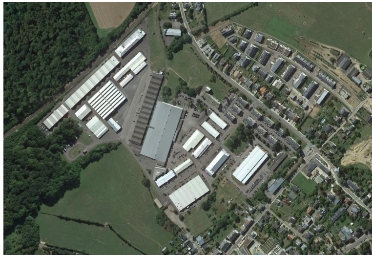
Luftaufnahme des NSPA-Geländes in Capellen aus dem Jahr 2023

Im Februar 2022 griff Russland die Ukraine an. Dieser völkerrechtswidrige Krieg führte in der NATO zu einer „Zeitenwende“: Viele NATO-Staaten hatten seit dem Ende des Kalten Krieges stark abgerüstet und immer weniger in ihre Verteidigung investiert. Viele Staaten haben zum Beispiel die Wehrpflicht abgeschafft. Jetzt ist das Verteidigungs- und Abschreckungspotenzial der NATO in den Augen vieler Mitgliedsstaaten nicht mehr ausreichend, um auf