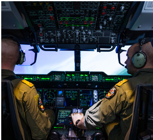
Piloten der Luxemburgisch-Belgischen binationalen Lufteinheit im Cockpit des A400M Transportflugzeugs.

Luxemburg ist einer der 12 Gründerstaaten der NATO. Das Großherzogtum ist zwar ein kleines Land, leistet aber in anderen Kernaufgaben wichtige Beiträge zur NATO, z.B. bei der Satellitenkommunikation. In Luxemburg befindet sich auch das Hauptquartier einer NATO-Organisation (NSPA), welche sich zum Beispiel um Logistik und Beschaffungen der Allianz kümmert.