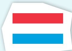
le drapeau luxembourgeois