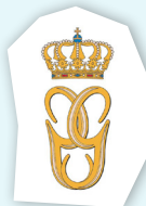
le monogramme du Grand-Duc Guillaume