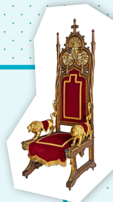
Le trône du Grand-Duc Guillaume était aussi celui du Grand-Duc Jean (1921 – 2019).

l'hymne « De Wilhelmus » qui est entonné lorsque le Grand-Duc ou un des membres de la famille grand-ducale, qui le représente, arrive à une cérémonie ou la quitte