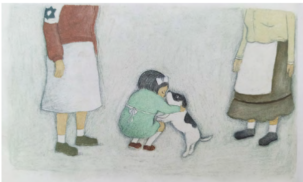
Abbildung aus dem Buch Marisha - das Mädchen aus dem Fass