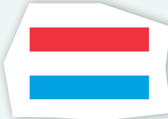
le drapeau luxembourgeois