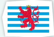
Le pavillon de la batellerie et de l'aviation