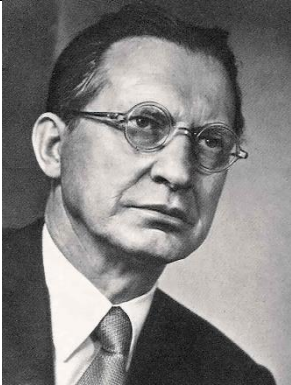
Alcide De Gasperi

Verbinde die Fotos mit den dazugehörigen Namen und den Gebäuden, die nach Ihnen benannt sind.