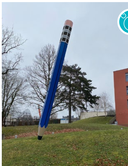
Trixi Weis, Crayons. Lycée Nic Biever, Dudelange

extrait de: Chimienti Pablo (2019), L'art public, un art pour tous. In: Le Quotidien (08.02.2019), https://lequotidien.lu/culture/serie-lart-public-un-art-pour-tous/ (date de la dernière consultation: 14.06.2021).