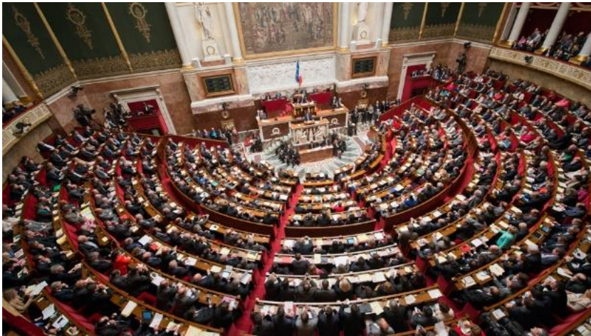
L'Assemblée nationale française