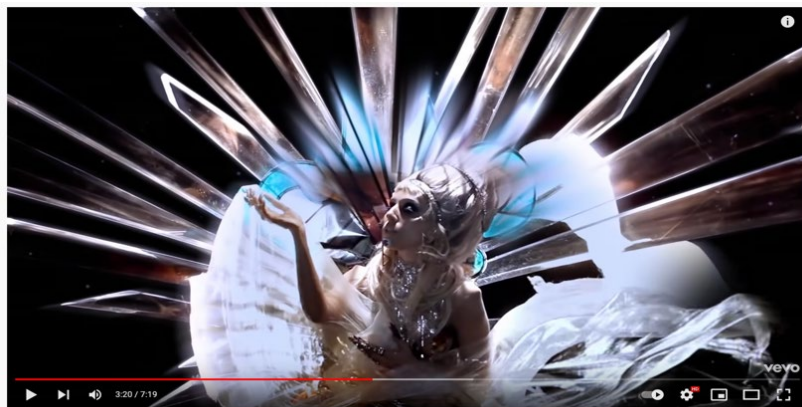
Lady Gaga - Born This Way (Official Music Video)

Lady Gaga, 2011. Lady Gaga - Born This Way (Official Music Video) . https://www.youtube.com/watch?v=wV1FrqwZyKw (zuletzt aufgerufen am 07.03.2022)