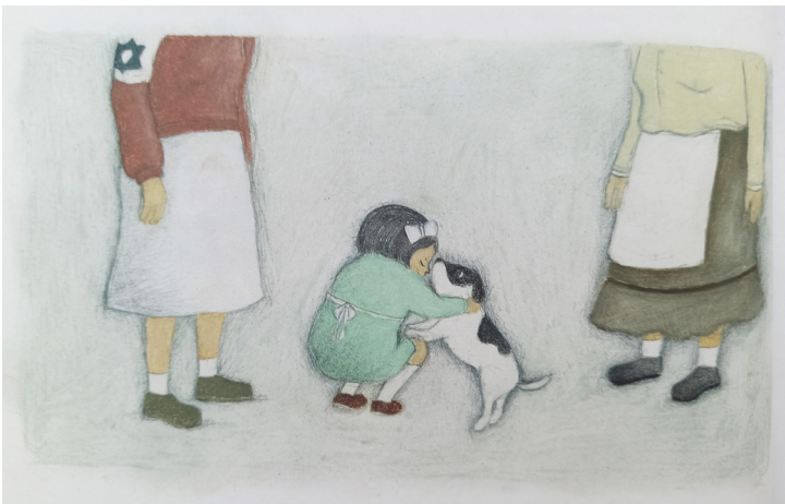
Abbildung aus dem Buch Marisha - das Mädchen aus dem Fass