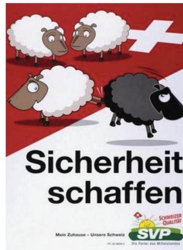
Affiche électorale du parti SVP pour les élections législatives d'octobre 2007 Suisse, 2007 https://diepresse.com/home/politik/aussenpolitik/329737/Schweiz-Rassistische-Wahlplakate-sorgen-fuer-Skandale (page consultée le 30.09.19)