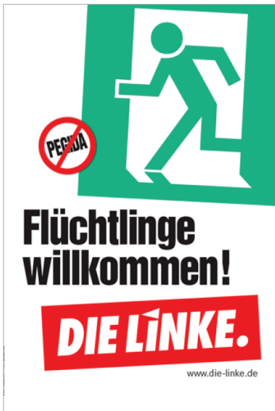
Affiche du parti « Die Linke » : Les réfugiés sont les bienvenus ! Allemagne https://shop.die-linke.de/index.php?lang=DEU&list=KAT11 (page consultée le 30.09.19)