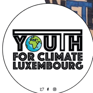
Fridays for Future manifestation, Luxembourg (14.03.2019)